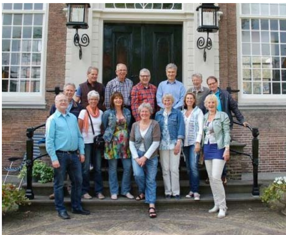
Gilde Haarlem heeft circa 15 gidsen