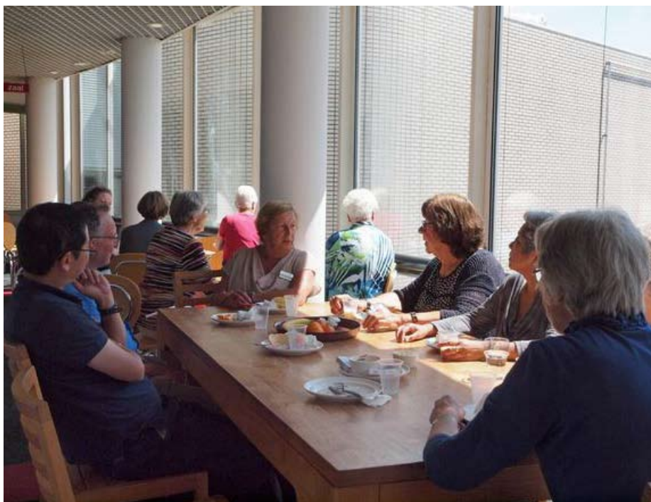
Na elke lezing de gezamenlijke lunch

april in Rotterdam, geeft Gilde Zeist een workshop over de Zomerschool. www.gildezeist.nl