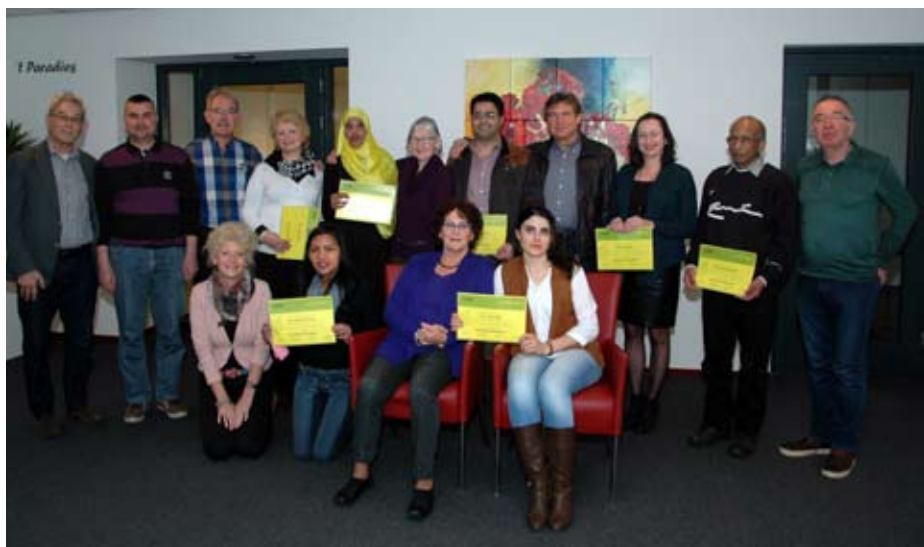
De kandidaten samen met hun taalcoaches

12 kandidaten uit Turkije, Afghanistan, Rusland, Irak, Filipijnen, Iran, Eritrea, Uganda en Polen kregen via de Gilde SamenSprak ieder een Taalmaatje vrijwilliger toegewezen om hem of haar een jaar lang, wekelijks te begeleiden bij het leren van de Nederlandse taal en cultuur. Daarbij behoorden ook activiteiten zoals het begeleid bezoeken van winkels, gemeentehuis, theaters, scholen, het leren maken van afspraken, solliciteren, informatie vragen, et cetera. Op deze wijze kunnen ze sneller integreren in de Nederlandse samenleving. Bij de bijeenkomst hoorde uiteraard de zeer gewaardeerde Limburgse vlaai en koffie en het blijkt dat veel nieuwkomers al goed bezig zijn om zich met hulp van de Gilde SamenSprak een plaats in onze samenleving te verwerven. Veel nieuwkomers