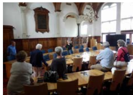
Excursie in het gemeentehuis