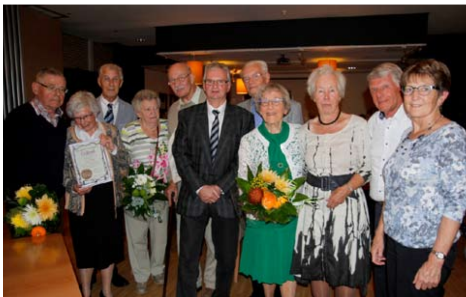
Het bestuur van Gilde Dordrecht en een vrijwilligster die een oorkonde ontving, onder meer voor een bijzondere prestatie en afscheid als stadsgids.

Daarnaast zijn er vrijwilligers actief om hulp te bieden bij het beter leren spreken en schrijven van de Nederlandse taal, want het begint met taal, nietwaar. Zie alle informatie op www.gilde-dordrecht.nl . (DordtCentraal)